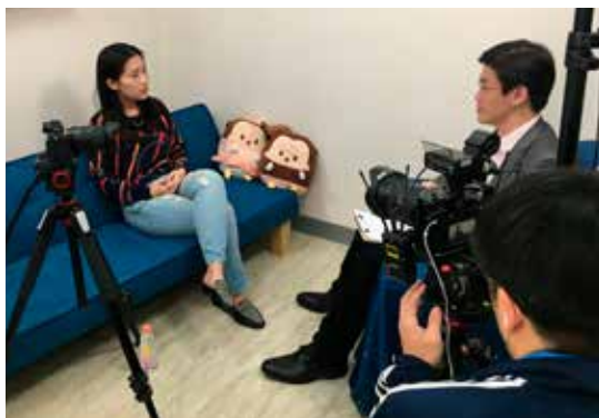
去年台灣總統大選期間，唐浩前往台灣，訪問館長等網紅、政治人物等。

住台灣的女士，原本是某位知名政論家的鐵粉，她在看了幾集節目之後，感謝節目讓她醒悟，發覺原來那位政論家的言論內容是設計過的，真正目的是在為中共宣導。還有一些年輕網友說他們雖然沒有能力挹注節目，但會一集一集的播放所有頻道節目、盡力點擊廣告，為了就是表達對節目的支持，唐浩說：「世界各地網友的反饋，讓我有許多感動與驚喜。」