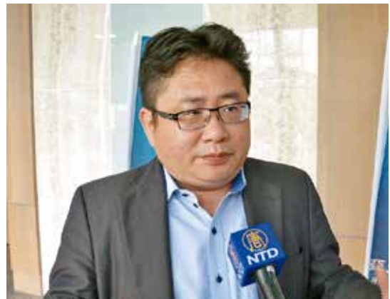
日本產經新聞台北支局局長矢板明夫