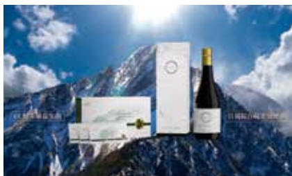
台灣酵素村有深受國內外信賴的產品