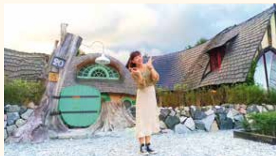
造型特殊的咖啡館，就像走入童話故事中的場景，好夢幻