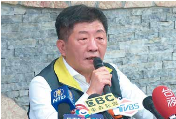
中央流行疫情指揮中心指揮官陳時中