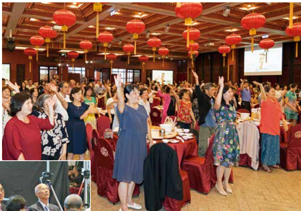
貴賓出席餐會實況