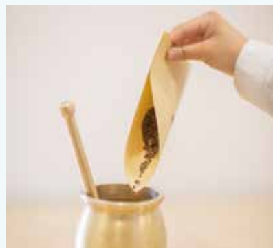
內心猶如容器，感恩善良更能保持健康

管，但次日尿澀痛，下腹脹痛，並檢查出綠膿桿菌，再度插回尿管，第二天開始發燒。一個半月後，當她再回診時，發燒 38.9 度，有氣無力的由子女扶進診間，坐下來講沒二句，就破口痛罵先生拋棄她，連三字經都用上了。剛才還病懨懨的，罵起人來勁道十足，口沫橫飛。我對她說：「大小姐，顧好自己的身體要緊，省省力氣，留給自己和病魔作戰。」我話才剛落下，她馬上又接上，指責每一位曾幫她治療的醫生，把她搞成這樣，最後連老天、神明也罵上。三兩句就帶髒話，那刺耳的魔音，污染了診所整個場，大家都忍受她放肆的怒吼！