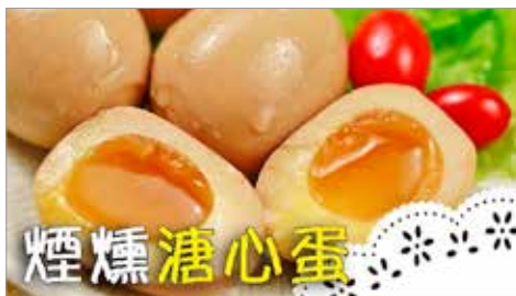
觀看次數：137 萬次 播出日期：2019 年 7 月 16

尺～理所當然榮登我們熱搜排行榜的TOP 2，想知道怎麼在家裡製作這些美食嗎？主廚不藏招、料理小撇步，通通告訴妳，跟著廚娘一起開心料理！