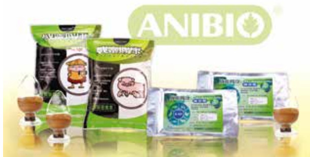
艾立生物研發——最高品質的靈芝健康飼料「威靈賜康」

幾經思量，他深知難以扭轉大眾的觀感，但實在不希望人們因噎廢食，無法領略到靈芝對健康的助益，於是便從多年養殖業的經驗中改變經營策略；廣納全台食品、畜牧、獸醫等科系精英，在 2002 年創立了「艾立生物」，獨創「漢方養殖法」，堅持有機栽種、專業調配高品質的「靈芝健康飼料」，營造出最佳的「食材生命力」，做最好的源頭把關，更以科學為本，研發出多種動物營養添加劑，讓豬、雞從此避免濫用抗生素及化學補充品和藥物，減少動物的患病率，使人們得以「食於心、享