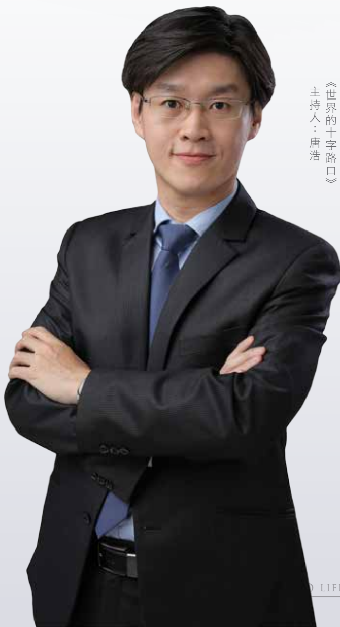
《世界的十字路口》 主持人：唐浩

共造假、威脅世界等事實，也諱莫如深。中共的一言堂體制不僅侵害了中、港、台的言論自由，還要繼續侵害世界。認清這點的唐浩說：「所以目前，中共是全球人民與新聞言論自由的最大敵人。如果媒體失去新聞自由，對人民來說，就會失去一個預警的『烽火台』，以及失去防護風險的『防火牆』。失去『烽火台』與『防火牆』是很可怕的事。所以我的感觸是，對抗中共極權擴張和滲透，已經成為現代新聞人職場職責和道德的新挑戰，以前沒有人想過這點，但是現在，你想成為一個真正的新聞