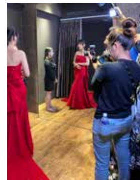
貼心的新娘管家服務，挑選船型到禮服的任何問題，都能提供專業建議