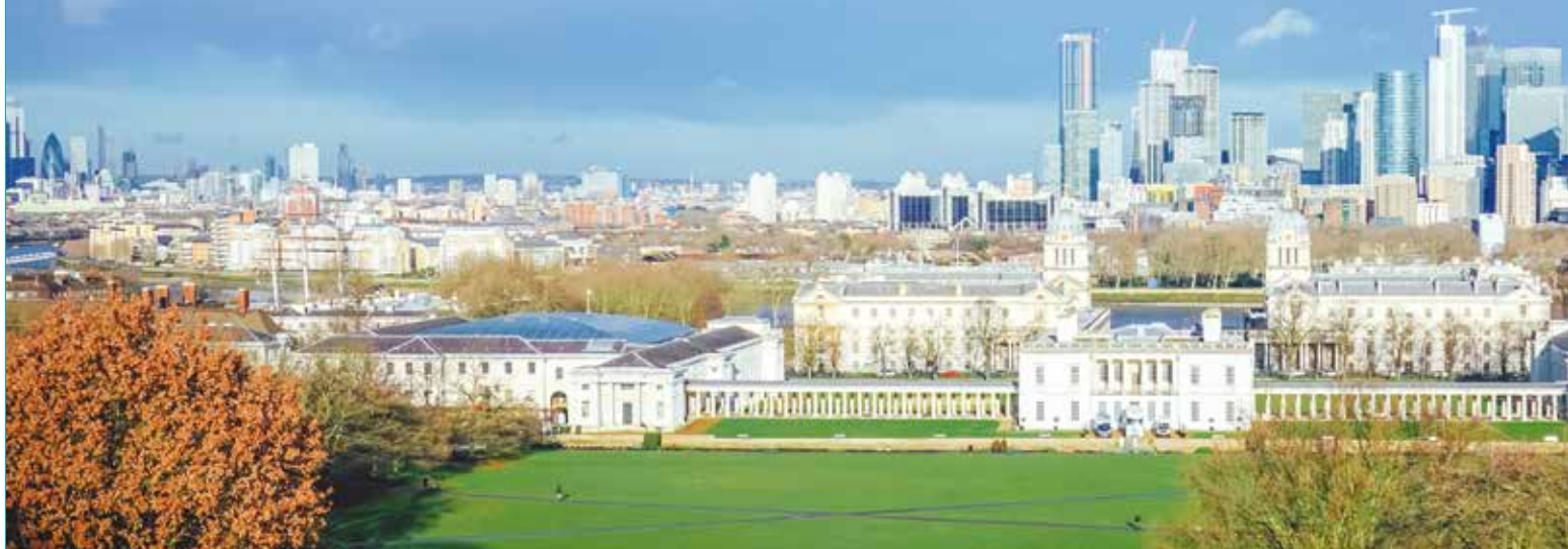
格林威治天文台望向倫敦市中心

清朗徜徉間，第四季의節目跟著主持人乘羽的腳步，沐浴在英國倫敦塔橋與格林威治冬日和煦的陽光中，共享韓德爾的音樂作品。跟著巴洛克的風情，暢遊在格林威治歷史古鎮中，並享受清晨 0℃ 氣溫的陽光，是一段既愜意又溫暖的畫面，令人格外的珍惜。