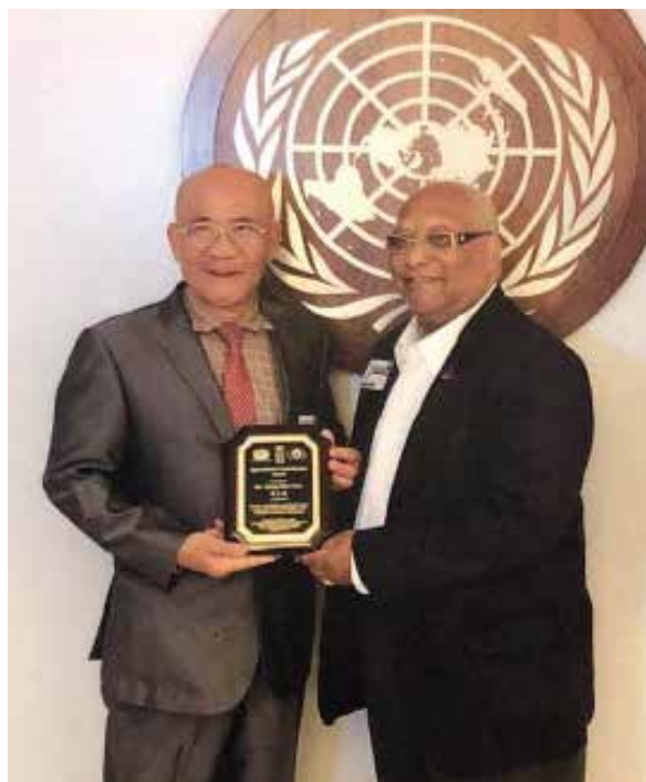
2018 年台灣酵素村獲頒聯合國表揚人類關懷獎