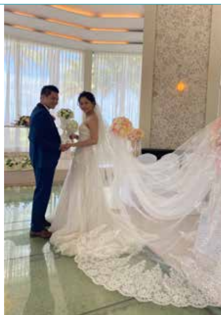
充滿回憶婚紗照，婚攝記憶滿分