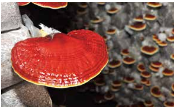
靈芝擁有珍貴的精華和元素，艾立生物做到最好的源頭把關

時也認識到西醫的治療無法改善他長年的宿疾，轉而尋求中草藥的治療；他發現菇蕈類稱「神仙草」的靈芝含有豐富的多醣體及三萜類，能對健康起到很好的幫助，果然在服用一段時日後，終於擺脫了困擾他三十多年的病痛！他遂發下了弘願，要研發出最好的靈芝保健品，讓更多的人們遠離病痛的折磨！