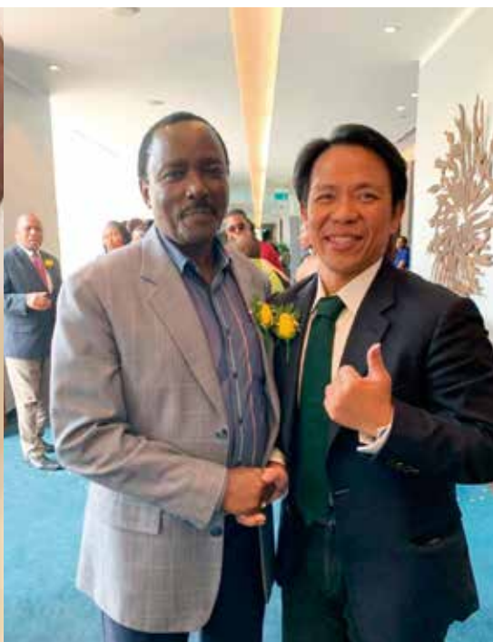
台灣酵素村董事長與肯亞副總統