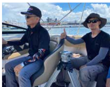
真正的大挑戰是在行進的船上拍攝

時間在愉快的拍攝氣氛中悄悄來到下午 5:30，當攝影師宣告「收工」的那一刻，所有人忍不住歡呼起來！歷經十小時的外拍任務圓滿成功！