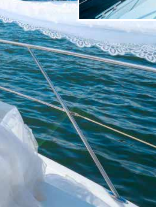
享受浪漫海天一色，一起來體驗遊艇婚紗的魅力