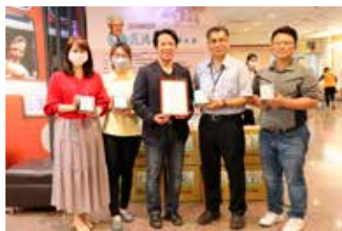
響應疫中送暖活動，台灣酵素村董事長與嘉義基督教醫院同仁合照