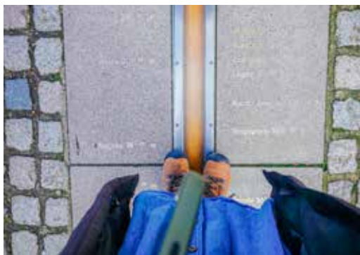
主持人乘羽站在格林威治天文台內的「本初子午線」上