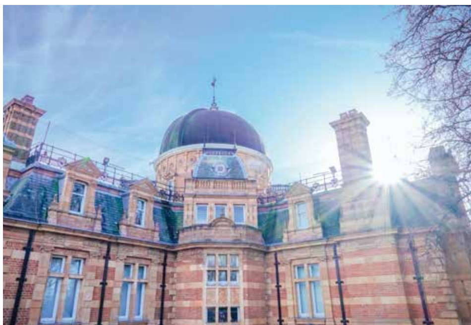
格林威治天文台一景

一個綜合性天文台，這裡有著知名的「本初子午線」，可別小看它，這條線可說是時間與空間的控制中心：