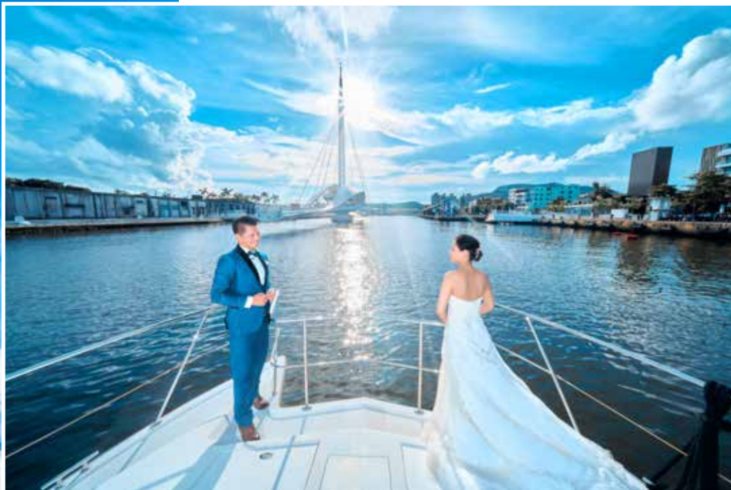
充滿度假氛圍的海上拍攝，一邊拍一邊玩，也能成為新人們的甜蜜回憶