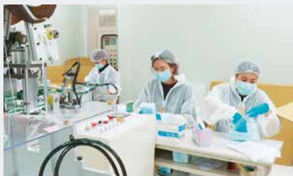
台灣民間「國家隊」協同政府創造防疫奇蹟

相較各國動盪不安，台大公衛計算，台灣解封指數 0.041(2020.7.8 數據)，居世界第二，比紐西蘭、泰國、越南都低，數據代表，疫情在台灣這塊寶島，幾乎絕跡。