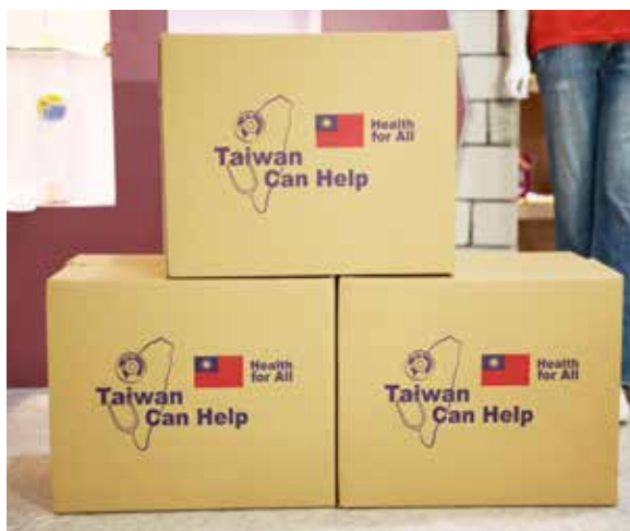
台灣口罩的研發、製作，在歷經 SARS 經驗後打下卓越的基礎

今年一月初爆發「中共肺炎」，疫情肆虐全球，各國無一倖免，災情慘重。防疫成了人們最關注的話題，而在所有防疫物資中，「口罩」一夕間已成為重點中的重點！