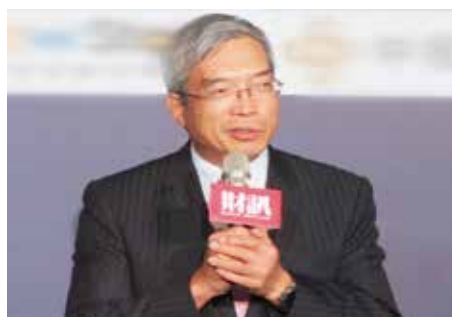
財信傳媒董事長謝金河