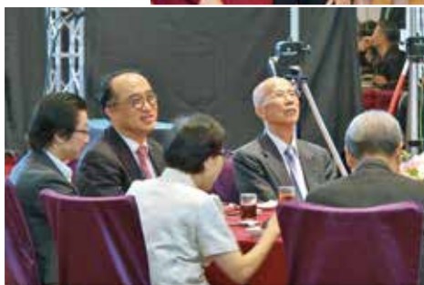
前駐法大使呂慶龍（右）餐會中專注於節目

上天似乎在 2020 年預設了什麼按鈕，啟動了，世界便開始翻轉。疫情肆虐，中美關係巨變，在在牽動全球。時局變化太快，讓人惶惶不知所以。此刻，知情權已成為生命權；如何獲得正確訊息，看清局勢，做出正確判斷和選擇，成為世人現階段最重要課題。在這紛亂的年代裡，媒體所扮演的角色也就更加關鍵了！