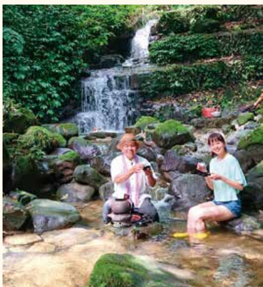
帶您遠離塵囂放鬆身心，在阿葉溪中賞飛瀑、品茶香

蜿蜒的溪水為席，就像走入古畫中，感受古人曲水流觴的閒情雅緻。接著來到阿里山的賞螢祕境——梨園寮車站，無人的車站，在春季夜間就成為螢火蟲出沒的地點，看那點點螢光飛舞在鐵道上，是初夏地表上最美的「螢河」。