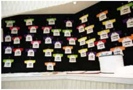
每件衣服代表一個口罩廠商