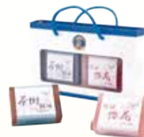
源森活手作美膚皂