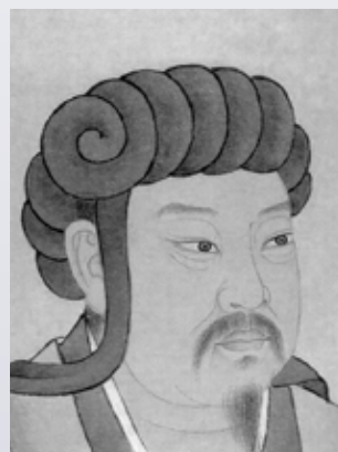
喬治六世、周星馳、諸葛亮都是唐浩學習的對象。