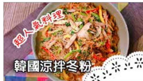
觀看次數：93 萬次 播出日期：2019 年 7 月 8 日

日本料理明星配菜，溏心蛋作法大公開！想知道溏心蛋要煮多久才不會太熟嗎？浸泡滷汁的比例怎麼調最好吃？跟著老師掌握這些小技巧，新手也能大成功！還有其他地方學不到的煙燻溏心蛋，煙燻後的蛋吃起來口感更豐富！