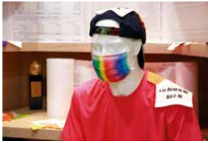
兼具美觀，外型酷炫的防疫口罩