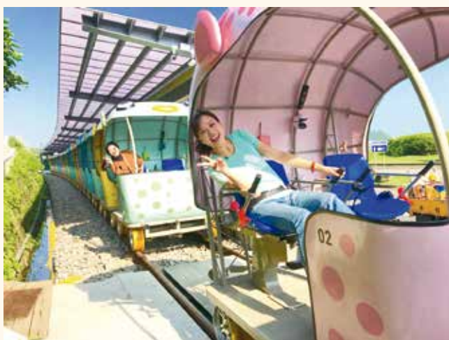
來八斗子騎著深澳鐵道自行車，吃產地直送的當令山海食材