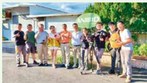
良心製造、台灣之光，艾立與新唐人團隊合影

現將「艾立」用心、良心製造每一產品、提供最佳服務、共享經濟等企業文化理念的堅持，透過「新唐人」國際行銷平台，讓好品牌躍上國際，好產品暢銷全球，成為真正的台灣之光！