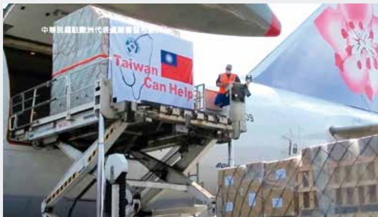
台灣模式被世界看見，政府至今年七月已捐出三波共超過 2300 萬片的口罩給各國防疫

道的考量，台灣絕對不能袖手旁觀，我們願意在口罩、藥物、技術這三項的項目，對國際社會提供協助，第一是口罩的資源，我們將捐贈一千萬片的口罩，支援疫情嚴重的國家的醫療人員。」