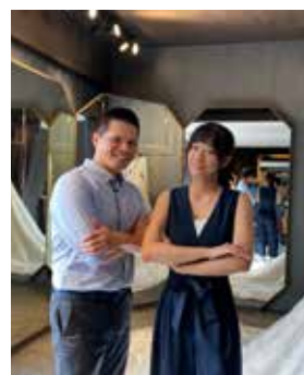
節目這次的大挑戰不是對戰，而是要攜手合作哟！