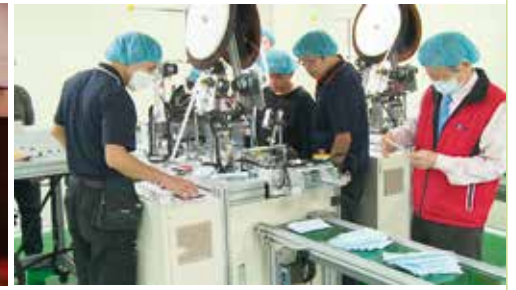
在政府和產業界共同努力下，台灣達成了成功的口罩外交

廠商雖然一時衝擊很大，但政府馬上與他們協商，給予合理的價格，將本來只有 3% 到 5% 的利潤，提高到 20% 到 30%。於是有了誘因，廠商願意全力拼產能。