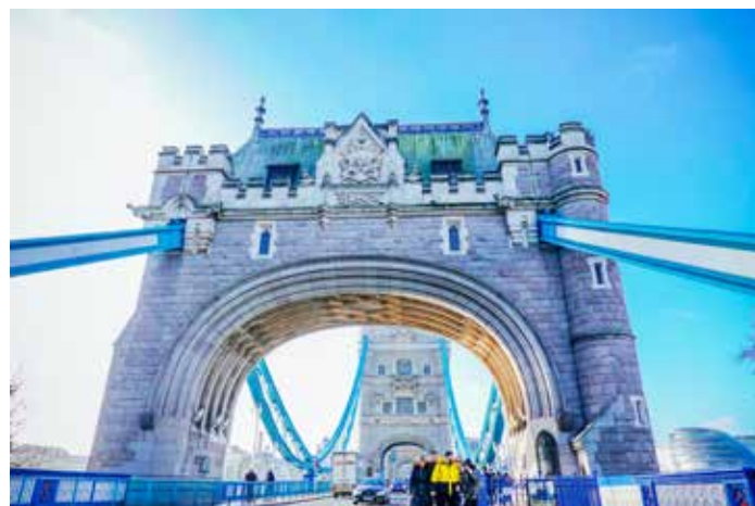
宏偉精緻的倫敦塔橋地景